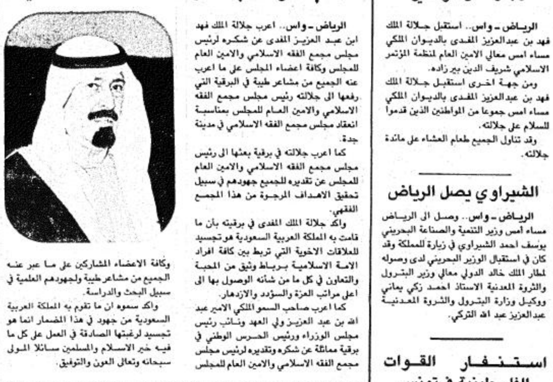
وكافة الأعضاء المشاركين على ما عر عنه الجميع من مشاعر طيبة ولجهوده العلمية في سبيل البحث والدراسة.

جلالة الملك وسمو ولي العهد يشكران رئيس مجلس مجمع الفقه الإسلامي الرياض - واس : اعرب جلالته الملك محمد بن عبد العزيز المفدى عن شكره لرئيس مجلس مجمع الفقه الإسلامي والأمين العام للمجمع وكافة أعضاء المجلس على ما اعرب عنه الجميع من مشاعر طيبة في البرقية التي رفعها الى جلالته رئيس مجلس مجمع الفقه الإسلامي والأمين العام للمجمع بمناسبة انعقاد مجلس مجمع الفقه الإسلامي في مدينة جدة. كما اعرب جلالته في برقية بعثها الى رئيس مجلس مجمع الفقه الإسلامي والأمين العام للمجمع عن تقديره للجهود التي تبذل في تحقيق الأهداف المرجوة من هذا المجمع الفقهي. واكد جلالته الملك المفدى في برقيته بأن ما قامت به المملكة العربية السعودية هو تجسيد للاتفاق الأخير الذي تربط بين كافة أفراد الأمة الإسلامية برعاية وتوثيق من المحبة والتعاون في كل ما شانه الوصول بها الى أعلى مراتب العزة والسؤدد والازدهار. كما اعرب صاحب السمو الملكي الامير عبد الله بن عبد العزيز ولي العهد ونائب رئيس مجلس الوزراء ورئيس الحرس الوطني في برقية مماثلة عن شكره وتقديره لرئيس مجلس مجمع الفقه الإسلامي والأمين العام للمجمع