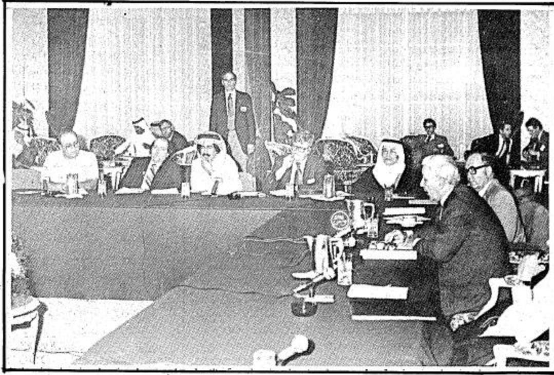
جانب من الصحفيين الذين حضروا المؤتمر

وزير المالية: سياستنا تشجع القطاع الخاص للقيام بدوره الطبيعي في التنمية وزير الخزانة: أرسينا أسساً جديدة للتعاون بين القطاعين الخاصين السعوديين والأمريكيين.. وتم إنجاز عشرين مشروعاً