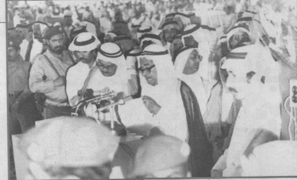
أحد أعيان القطيف يلقي كلمة الأهالي