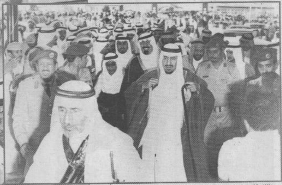
الملك خالد لدى وصوله الى مقر الحفل، وخلفه بيدو سمو الأمير عبدالله مبهتاً.