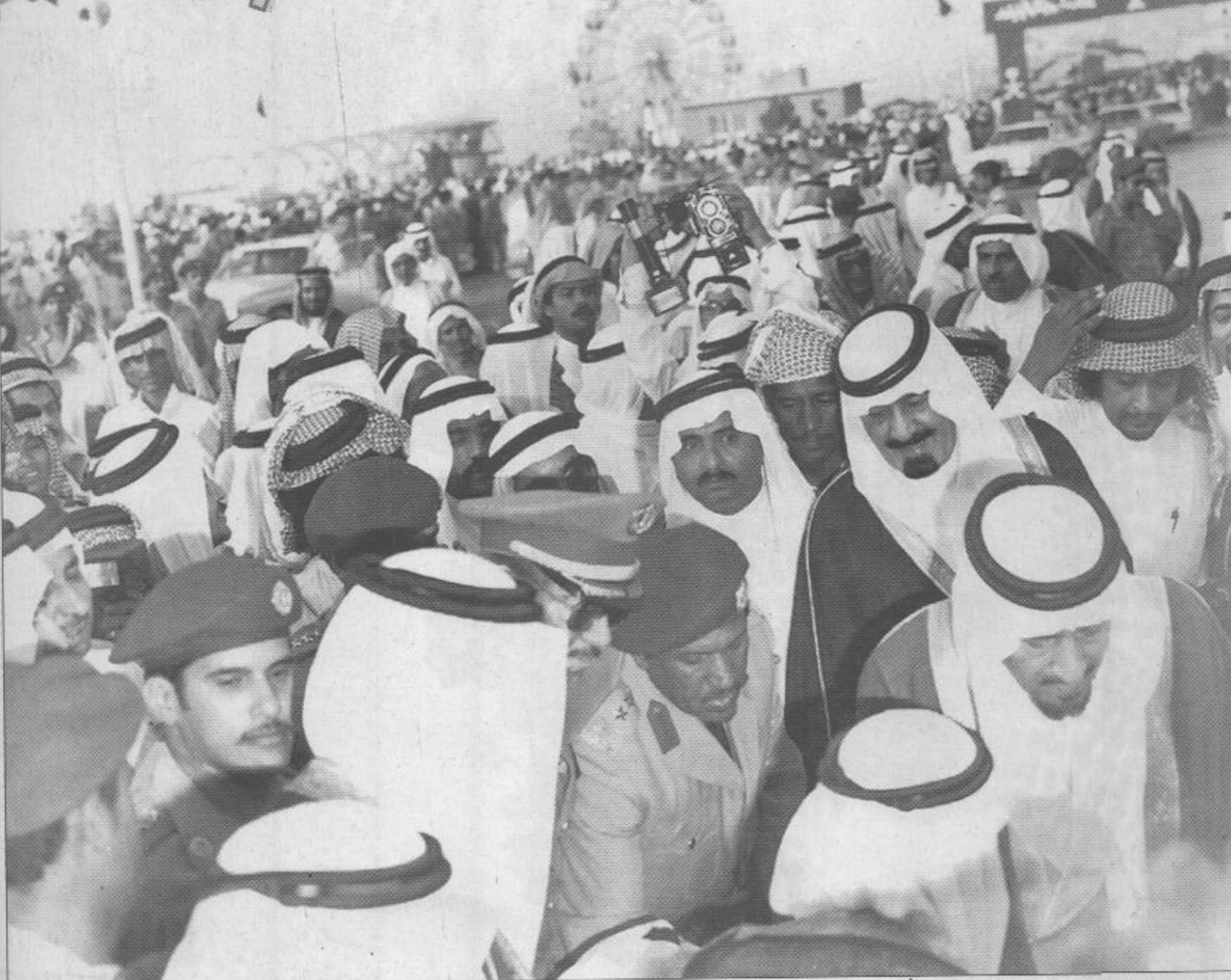
صورة أخرى للملك خالد، وخلفه ابتساماً أخرى للأمير عبدالله.