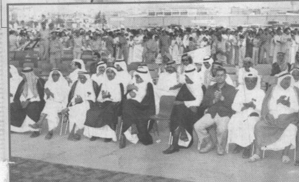
جانب من المسئولين الذين حضروا الحفل