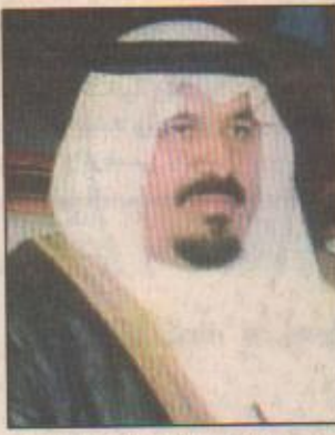
الدمام - أحمد المحبوب قدم صاحب السمو الملكي الأمير سلطان بن عبدالعزيز آل سعود نائب أمير المنطقة الشرقية رافعا شكره وشكر أهالي محافظة حفر الباطن والذي سيكون له

بسان الله تعالي أكبر الأثر في رفع المعاناة عن مرضى الكلى في المحافظة داعيا الله العليّ القدير أن يجعل ذلك في ميزان أعماله وأن يمد في عمره وأن يمنعه بمؤفوف الصحة والعافية.