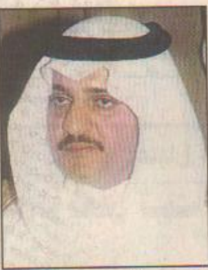
الرياض - واس بناء على أمر خادم الحرمين الشريفين الملك فهد بن عبدالعزيز آل سعود القائد الأعلى لكافة القوات العسكرية - حفظه الله - والقاضي بإحداث نوط عسكري يسمّى (الذكرى النونية) يصنع جميع الضباط والأفراد وطلاب القوات العسكرية بجميع قطاعاتها وزارة الدفاع والطيران والحرس الوطني ووزارة الداخلية برئاسة الاستخبارات العامة والظنونا من حملة السلاح والمجاهدين الموجودين على رأس العمل يوم ١٤١٩/١/٥ هـ وللصالحين من منسوبي المنشآت والبعثات العامة والظنونا المتمدنين والمخفين لدى المملكة في هذا التاريخ فقد صدرت موافقة صاحب السمو الملكي الأمير عبدالله بن عبدالعزيز ولي العهد ونائب رئيس مجلس الوزراء ورئيس الحرس الوطني باعتماد التكاليف المالية اللازمة لذلك.