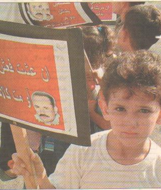
طفل يرفع صورة أبو علي في المظاهرات

مدير شرطة الشارقة السابق اللواء الناصر: • لا توجد جريمة ضد مجهول • الابتدائية القديمة تعادل الجامعية في الوقت الحالي (رجال تحت الشمس)