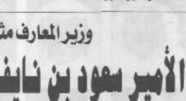
سمو النائب الثاني لدى استقباله القائمة بالأعمال بالسفارة الأمريكية