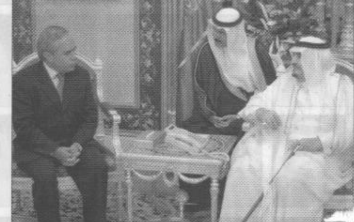
سمو ولي العهد يستقبل الامراء والوزراء والمواطنين