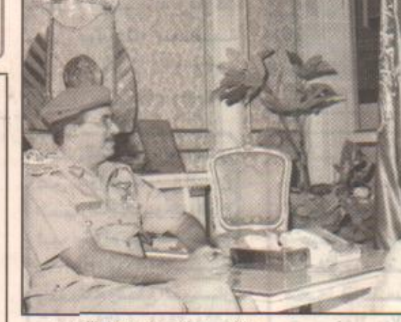
الأمير عبدالرحمن يستقبل اللواء العمري

وقد جرى خلال المقابلة تبادل الاحاديث الودية بينهما.