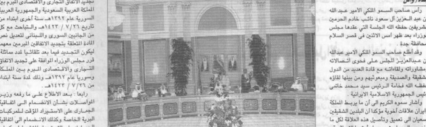
نائب خادم الحرمين الشريفين يترأس جلسة مجلس الوزراء «واس»

الموافقة على آلية توزيع الإيرادات الجمركية لدول مجلس التعاون انضمام المملكة إلى اتفاقية الجمارك على الاستيراد المؤقت للمركبات البرية الأمير عبد الله بن عبدالعزيز نائب رئيس الحرس الوطني في دورته الحادية والعشرين الخاص بالسماح لمواطني دول المجلس الطبيعيين والاعثاريين بممارسة جميع الأنشطة الاقتصادية والمهن دون تحديد وفقا للشروط التي أقرها المجلس الأعلى في دورته الثامنة باستثناء القائمة المرفقة لذلك القرار فقد قرر مجلس الوزراء قيام الجهات المختصة باتخاذ ما يلزم لتطبيق قرار المجلس الأعلى لمجلس التعاون لدول الخليج العربية المنوه عنه. ثانيا: بعد الاطلاع على ما رفعه وزير المالية والاقتصاد الوطني بشأن قرار المجلس الأعلى للتعاون لدول الخليج العربية في دورته الحادية والعشرين الخاص بالسماح لمواطني دول المجلس الطبيعيين والاعثاريين بممارسة جميع الأنشطة الاقتصادية والمهن دون تحديد وفقا للشروط التي أقرها المجلس الأعلى في دورته الثامنة باستثناء القائمة المرفقة لذلك القرار فقد قرر مجلس الوزراء قيام الجهات المختصة باتخاذ ما يلزم لتطبيق قرار المجلس الأعلى لمجلس التعاون لدول الخليج العربية المنوه عنه. ثالثا: بعد الاطلاع على العمالة المرفوعة من معالي وزير المالية والاقتصاد الوطني حول