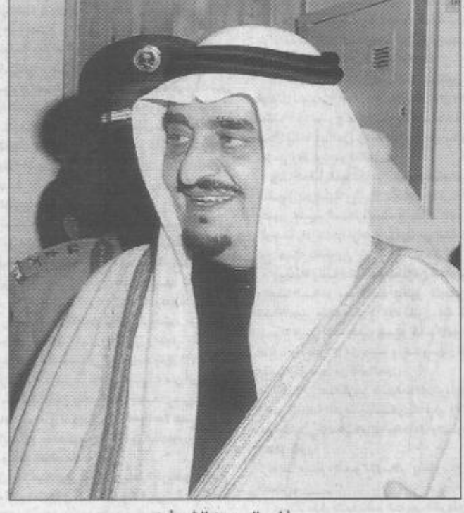
خادم الحرمين الشريفين

سمو ولي العهد يستقبل الحريري الرياض / واس استقبل صاحب السمو الملكي الأمير عبدالله ابن عبدالعزيز ولي العهد ونائب رئيس مجلس الوزراء ورئيس الحرس الوطني في قصر سموه بالرياض أمس دولة رئيس الوزراء اللبناني السابق رفيق الحريري. وجرى خلال المقابلة تبادل الاحاديث الودية كما قدم الحريري لصاحب السمو الملكي الأمير عبدالله ابن عبدالعزيز التهنية بالذكرى المئوية للمملكة العربية السعودية.