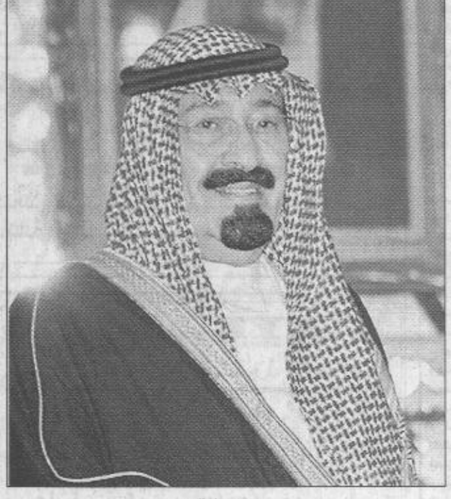
سمو ولي العهد