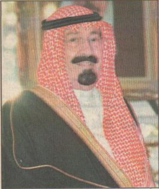
سمو ولي العهد

الرياض / فهد الشملاني بمشيئة الله تعالى يفتتح صاحب السمو الملكي الأمير عبدالله بن عبدالعزيز وفي العهد ونائب رئيس مجلس الوزراء ورئيس الحرس الوطني يوم الأحد القادم معرض «سقر الجزيرة» الذي تقيمه القوات الجوية على الطريق الدائري الشرقي بالرياض. صرح بذلك لـ (اليوم) الفريق عبدالعزیز محمد هنيدي قائد القوات الجوية، وأضاف: إن المعرض يحتوي على عدد من الطائرات القديمة المستخدمة في القوات الجوية الملكية قديماً وتحكي التسلسل التاريخي للقوات الجوية وكذلك يضم المعرض بعض المقتنيات والوثائق والصور التي تجسد المراحل الأولى من توحيد هذا البناء الشامخ على يد القائد الباني جلالة الملك عبدالعزيز بن عبدالرحمن آل سعود - رحمه الله - بالإضافة إلى بعض الطائرات الحديثة ليتمكن الزائر من المقارنة بين ما هو مستخدم من الطائرات قديماً وحديثاً ويطلع على التقنية الحديثة المتطورة التي حدثت في القوات الجوية الملكية لكي تكون درعاً وافية لهذا الوطن العزيز ضد كل معاد.