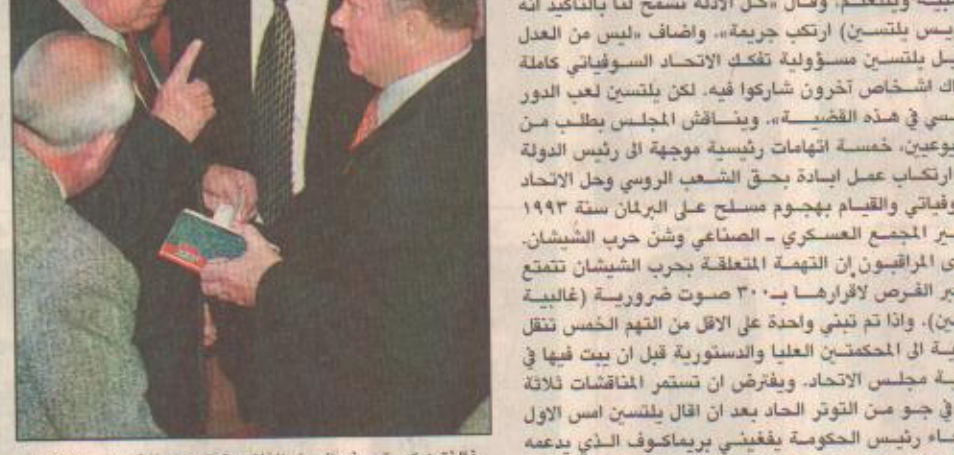
فانلنغين كويتسوف الرجل الثاني في الحزب الشيوعي يتحدث إلى غينادي زيبوف خلال جلسة البرلمان

دبي / واس اتهمت الأمم المتحدة أمس النظام العراقي بأنه يخزن أكثر من نصف الأدوية والتجهيزات الطبية التي اشتراها بموجب برنامج النفط مقابل الغذاء. وأكد المتحدث باسم برنامج العراق في مكتب الأمم المتحدة في نيويورك جون ميلز في بيان تلقته وكالة الصحافة الفرنسية في دبي ان مخازن الحكومة العراقية ممتلئة عن آخرها بالأدوية. وأضاف (ميلز) انه وفق الأرقام التي تملكها فان أدوية وتجهيزات طبية بقيمة ٥٧٠ مليون دولار وصلت إلى العراق منذ بدء تنفيذ برنامج النفط مقابل الغذاء. وأضاف ان شاعلاًنا الرئيسي هو ان ٤٨ في المائة فقط من ٢٧٨٨ مليون دولار وزع على العيادات والمستشفيات والصيدليات. وشدد (ميلز) على ان أكثر من ٩٩ في المائة من العقود التي تقدم بها العراق إلى الأمم المتحدة في مجال الصحة خلال المراحل الثلاث الأخيرة من برنامج النفط مقابل الغذاء تمت الموافقة عليها. وأوضح انه خلال المرحلة الرابعة من البرنامج التي انتهت في نوفمبر الماضي فان عقوداً بقيمة ١٥٥ مليون دولار تمت الموافقة عليها فيما لم تتجاوز قيمة العقود التي علقت في لجنة العقوبات التابعة للأمم المتحدة ١٥ مليون دولار ووصلت إلى العراق خلال المرحلة نفسها تجهيزات طبية بقيمة ٦٤ مليون دولار لكن قيمة التجهيزات التي وزعت لم تتجاوز ١٦ مليون دولار. وتابع ميلز انه خلال المرحلة الخامسة التي تنتهي في ٢٤ مايو الجاري تقدم العراق إلى الأمم المتحدة بعقود تبلغ قيمتها ١١٤ مليون دولار تشكل حوالي نصف المبلغ المخصص للأدوية والتجهيزات الطبية في هذه المرحلة.