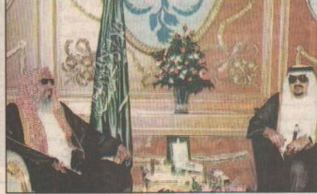
خادم الحرمين الشريفين لدى استقباله مفتي المملكة

جدة / واس استقبل خادم الحرمين الشريفين الملك فهد بن عبدالعزيز آل سعود في مكتبه بقصر السلام أمس سماحة الشيخ عبدالعزيز بن عبدالله ابن محمد آل الشيخ المفتي العام للمملكة العربية السعودية ورئيس هيئة كبار العلماء وإدارة البحوث العلمية والإفتاء بمناسبة تعيينه في منصبه الجديد. كما استقبل خادم الحرمين الشريفين في مكتبه بقصر السلام أمس فضيلة الشيخ صالح اللحيدان رئيس مجلس القضاء الأعلى وفضيلة الشيخ راشد بن خنين المستشار في الديوان الملكي الذين قدما تعازيها لخادم الحرمين الشريفين حفظه الله في فقيد الأمة سماحة الشيخ عبدالعزيز بن عبدالله بن باز - رحمه الله - وحضر الاستقبال صاحب السمو الملكي الأمير متعب بن عبدالعزيز وزير الأشغال العامة والإسكان وصاحب السمو الملكي الأمير عبدالعزيز بن فهد ابن