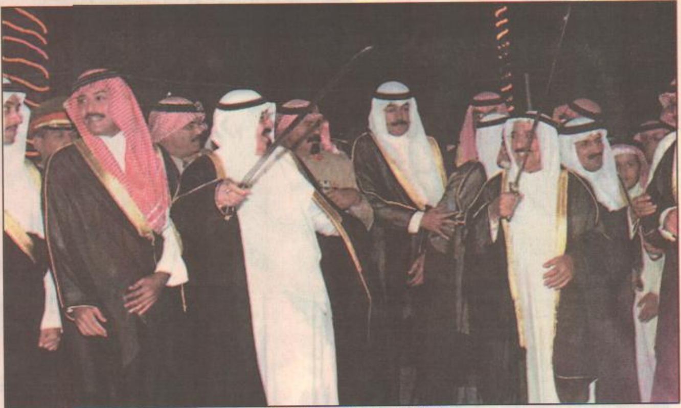
لقاء أخري لسمو الأمير عبدالله في الكويت