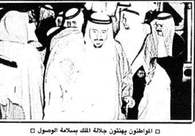
المواطنون يهتفون بجلالة الملك بسلامة الوصول

الرياض: واس وصل حضرة صاحب الجلالة الملك المعظم بسلامة الله وراحته الى الرياض مساء امس عائدًا من المنطقة الشرقية بعد ان قضى فيها فترة من الوقت لتفقد خلالها احوال المنطقة.. حفظه الله جلالته في حله وتوكله. وكان جلالته الملك خالد بن عبدالعزيز المضي قد غادر مطار الظهران في الساعة السادسة والرابع من مساء امس متوجها بحفظ الله وراحته الى الرياض في ختام زيارته للمنطقة.