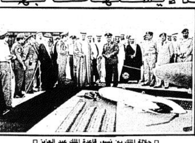
جلالة الملك بين نسور قاعدة الملك عبد العزيز

الرياض: واس وصل حضرة صاحب الجلالة الملك المعظم بسلامة الله وراحته الى الرياض مساء امس عائدًا من المنطقة الشرقية بعد ان قضى فيها فترة من الوقت لتفقد خلالها احوال المنطقة.. حفظه الله جلالته في حله وتوكله. وكان جلالته الملك خالد بن عبدالعزيز المضي قد غادر مطار الظهران في الساعة السادسة والرابع من مساء امس متوجها بحفظ الله وراحته الى الرياض في ختام زيارته للمنطقة.