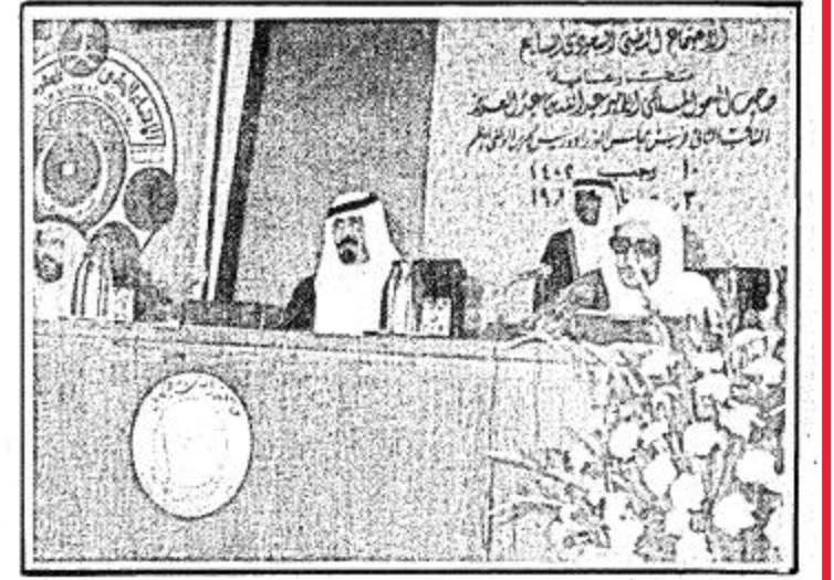
سموه يستمع الى كلمة وزير التعليم العالي

العزير: نائب رئيس مجلس الوزراء... التفخر الأول لكلية الطب والعلوم الطبية ثم تفصيلاً... برعاية هذا الاجتماع الطبي الهام.