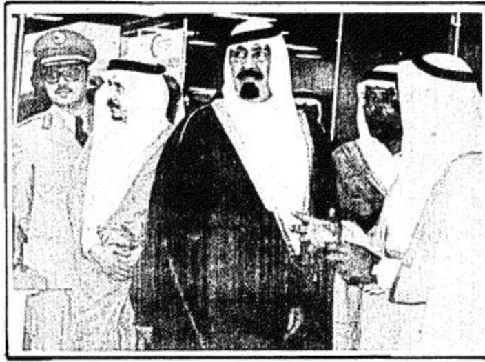
سموه يتجول في معرض الكتاب الطبي