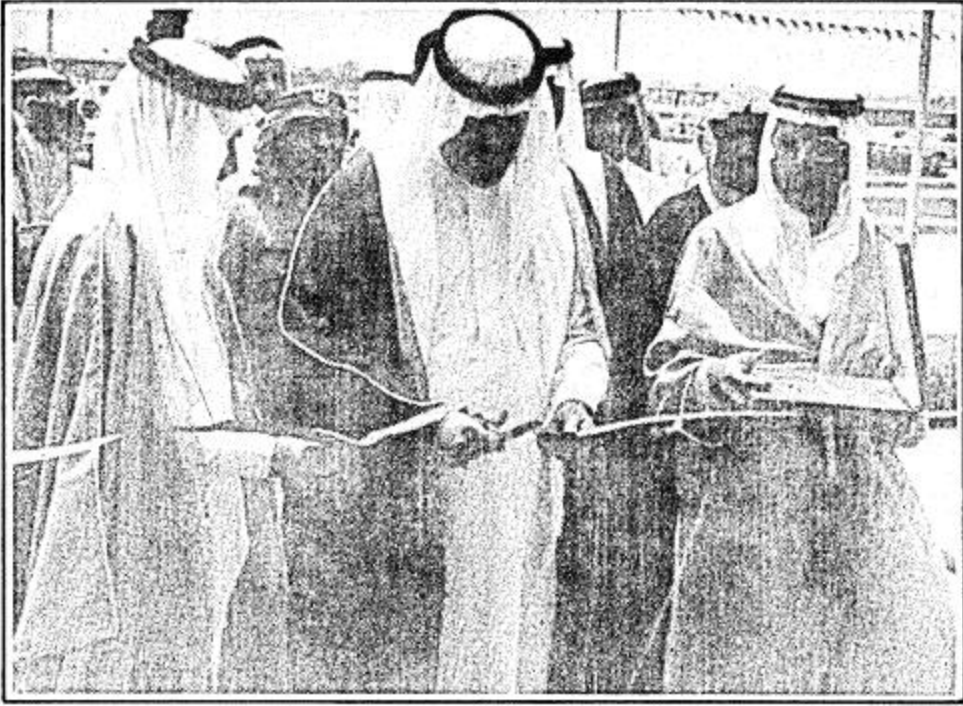
سمو الأمير عبدالله يفتتح الاجتماع

وكيل صحة البحرين.. نيابة عن الوفود.. شاكراً تشريف سمو الأمير عبدالله للاجتماع: