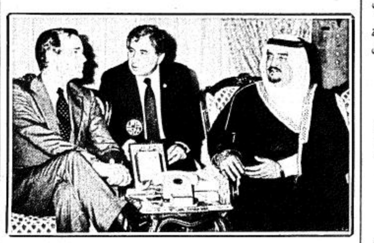
□ جلالة الملك المفدى يستقبل نائب الوثيس الامريكي □

شبعب وحكومة الولايات المتحدة يشعرون بالأسى لوفاة الملك خالد ويتعاطفون مع المملكة لفقدانها رجسلا حكيما