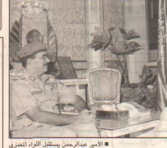
الأمير عبدالرحمن يستقبل اللواء العمري

واس قبل صاحب السمو الملكي الأمير عبدالرحمن بن عبدالعزيز نائب وزير الدفاع والطيران والمفتش العام أمس بمكتب سموه بالرياض الامين العام المساعد لمجلس التعاون لدول الخليج العربية للشؤون العسكرية اللواء الركن بن بن سالم مسعود العمري حيث تشرف بالسلام على سموه بمناسبة تعيينه اميناً عاماً مساعداً للشؤون العسكرية لمجلس التعاون لدول الخليج العربية. وقد جرى خلال المقابلة تبادل الاحاديث الودية بينهما.