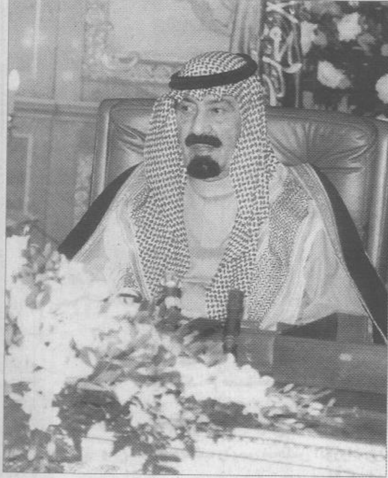
سمو الامير عبدالله بن عبدالعزيز

الملك: هذه الزيارة لسمو ولي العهد امتداد لزيارته المتواصلة لعدد من المناطق الوقوف على احتياجاتها!!