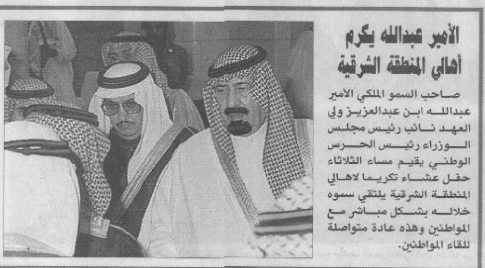
صاحب السمو الملكي الأمير عبدالله بن عبدالعزيز ولي العهد نائب رئيس مجلس الوزراء ورئيس الحرس الوطني يقيم مساء الثلاثاء حفل عشاء تكريماً لأهالي المنطقة الشرقية يلتقي سموه خلاله بشكل مباشر مع المواطنين وهذه عادة متواصلة للقاء المواطنين.

محل اعزاز وتقدير مواطني المنطقة الشرقية وأوضح سموه: ان الزيارة تحمل في طياتها العديد من عطايا الخير والنماء لهذا الجزء الغالي من المملكة والتي تتمثل في افتتاح وضع حجر الأساس للعديد من المشروعات التنموية التي سيكون لها كبير الأثر في دعم مسيرة التنمية والتطوير التي تشهدها المملكة. واختتم سمو الأمير محمد بن فهد تصريحه بالشكر والتقدير لخادم الحرمين الشريفين الملك فهد بن عبدالعزيز وإلى سمو ولي عهده الأمين وإلى سمو النائب الثاني على ما يبذلونه في سبيل تطوير ورخاء هذه البلاد. ورحب صاحب السمو الملكي الأمير سعود بن نايف بن عبدالعزيز نائب أمير المنطقة الشرقية بزيارة سمو الأمير عبدالله.. وقال ان الزيارة تعني الاهتمام والحرص على راحة المواطنين ومتابعة أحوالهم. وأضاف ان المنطقة تتميز بهذه الزيارة الكريمة، والمشروع التي يفتتحها سموه ويضع حجر الأساس لعدد منها ما هي إلا امتداد لمشاريع تنمية تعيشها المملكة. من جهته قال صاحب السمو الملكي الأمير مشاري بن سعود بن عبدالعزيز وكيل الحرس الوطني وسموه: إن هذه الزيارة الكريمة هي