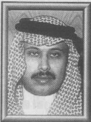
بقل / صاحب السمو الملكي الأمير مشاري بن سعود بن عبدالعزيز