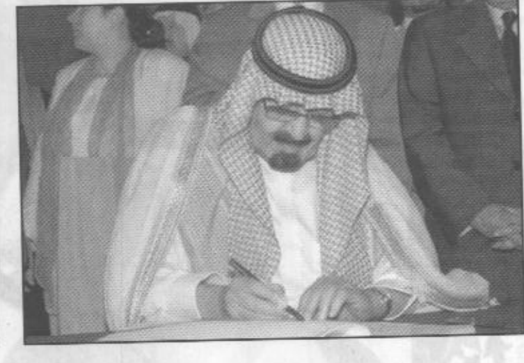
لحظات من زيارة سمو ولي العهد لملكة الإسكندرية