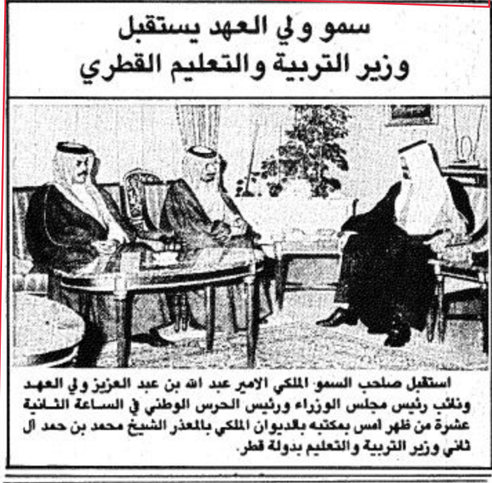
استقبل صاحب السمو الملكي الأمير عبد الله بن عبد العزيز ولي العهد ونائب رئيس مجلس الوزراء ورئيس الحرس الوطني في الساعة الثانية عشرة من ظهر أمس بمكتبه بقديوان الملك بالعدن الشيخ محمد بن حمد آل ثاني وزير التربية والتعليم بدولة قطر.

الرياض-واس- عقد مجلس الوزراء جلسة مساء أمس برئاسة صاحب السمو الملكي الأمير عبدالله بن عبد العزيز ولي العهد ونائب رئيس مجلس الوزراء ورئيس الحرس الوطني. وصرح معالي وزير الإعلام الدكتور محمد عبده يماني عقب الجلسة لوكالة الأنباء السعودية بأن المجلس اطلع في مستهل جلسته على تقرير مفصل بعث به صاحب السمو الملكي الأمير سعود الفيصل وزير الخارجية عن نتائج اجتماعات وأعمال مؤتمر قمة عدم الانحياز السابقة التي عقدت في نيودلهي. كما اطلع المجلس على البيان الختامي الذي صدر في ختام القمة وقد أعرب المجلس عن ارتياحه لحصيلة لقاء دول حركة عدم الانحياز في نيودلهي وخاصة فيما يتعلق بدعم القضايا العربية العادلة وفي مقدمتها [البقية على ص ٣٠]