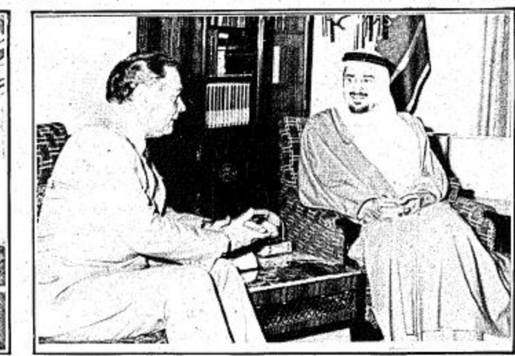
■ جلالته يستقبل وزير الخارجية الامريكي ■

بسم الله الرحمن الرحيم - السنة الثامنة عشرة - العدد ٣١٥٩ الخميس ٥ جمادي التائية ١٤٠١ هـ - الموافق ٩ ابريل ١٩٨١م