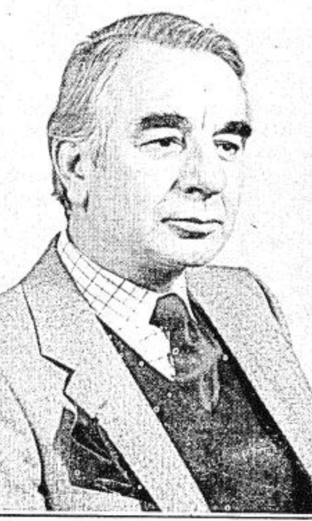
السفير البريطاني جيمس كريج

جدة: عبدالرحمن ادريس وصف السيد جيمس كريج سفير المملكة المتحدة «بريطانيا» لدى المملكة مشروع الفهد للسلام في الشرق الأوسط بأنه يعتبر خطوة ايجابية الى الامام في الجهود الدولية المبذولة من اجل تحقيق السلام العادل والشامل في الشرق الأوسط. واضاف: اننا في بريطانيا وفي مجموعة السوق الاوروبية المشتركة نرحب بمناقشة المقترحات الواردة في المشروع.. كما نامل ان يجيز مؤتمر القمة العربية القادم والمقرر عقده في شهر نوفمبر المقبل في المغرب هذه المقترحات والمبادئ التي تضمنها مشروع سمو الأمير فهد. وقال ان بريطانيا ملتزمة بقوة مثل بقية اعضاء المجموعة الاوروبية العشرة بالسياسة الاوروبية المشتركة الخاصة بمشكلة الشرق الأوسط وهي سياسة متميزة بالوضوح التام عن السياسة الامريكية تجاه قضية الشرق الأوسط. واشاد السفير البريطاني بالدور الذي تلعبه المملكة في الساحة الدولية من اجل تسوية هذه القضية تسوية سلمية وعادلة وشاملة. واضاف قائلاً: اننا ننظر بعين الإعجاب للدور الذي تلعبه المملكة العربية السعودية، فهو فعلاً دور ايجابي معتدل وذو تأثير واضح على القضايا الدولية وليس قضية الشرق الأوسط وحدها. وقال: انه في نطاق الدور السعودي فقد ابدت جلالته ملكة بريطانيا اهتماماً وتقديراً خاصين لتصرف المملكة العربية السعودية حيال انتاج البترول وتحديد اسعاره (٣٠)