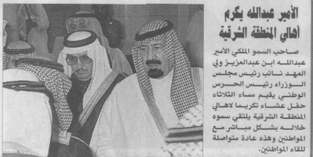
صاحب السمو الملكي الأمير عبدالله بن عبدالعزيز ولي العهد نائب رئيس مجلس الوزراء رئيس الحرس الوطني يقيم مساء الثلاثاء حفل عشاء تكريماً لأهالي المنطقة الشرقية يلتقي سموه خلاله بشكل مباشر مع المواطنين وهذه عادة متواصلة للقاء المواطنين.