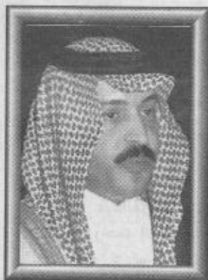
بقر / صاحب السمو الملكي الأمير مشعل ابن بدر بن سعود بن عبدالعزيز

تحظى الزيارة الميمونة التي يقوم بها سيدي صاحب السمو الملكي الأمير عبدالله بن عبدالعزيز ولي العهد ونائب رئيس مجلس الوزراء ورئيس الحرس الوطني بحفظه الله للمنطقة الشرقية اليوم باهتمام رسمي وشعبي لأنها زيارة خيرة ومباركة يفتتح من خلالها يحفظه الله بعض المشاريع التنموية العملاقة في المنطقة الشرقية والأحساء، كما يستقبل سموه أهالي المنطقة الشرقية ويلتزم أعزاه الله مشاكل وهموم المواطن.. وهذا جسد ذاته يجسد أجمل صور التلاحم الانساني في جسد المجتمع السعودي من خلال تكافله وتعاضده وترابط قيادته بقاعدته على أساس الولاء والوفاء والحب والعطاء وتراص أبنائه بعضهم ببعض.