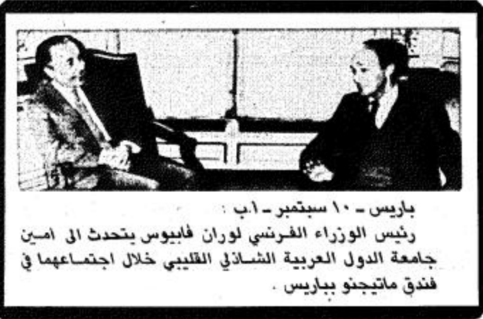
باريس - ١٠ سبتمبر رئيس الوزراء الفرنسي لوران فابوس يتحدث في امين جاحمة الدول العربية الشاذلي القليبي خلال اجتماعهما في فندق ماتيجنو بباريس

هذا ويخفي الاتفاق الذي تم التوصل اليه بين شمعون بيريز زعيم حزب العمل الاسرائيلي بشأن تشكيل حكومة ائتلاف واسحاق شامير زعيم الحكومة