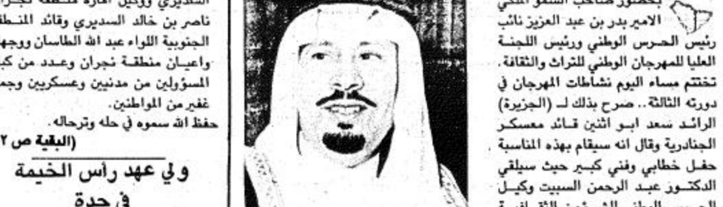
عبد الله محمد الحواس □ الامير بدر بن عبد العزيز □ سلامة العبد الله، والطلوجيست عبد العزيز المبدل ومن المحتمل مشاركة (البلدية ص ٢٢)

كتب / عبد الله محمد الحواس بحضور صاحب السمو الملكي الامير بدر بن عبد العزيز نائب رئيس الحرس الوطني ورئيس اللجنة العليا للمهرجان الوطني للتراث والثقافة. اختتم مساء اليوم نشاطات المهرجان في دورته الثالثة. صرح بذلك لـ (الجزيرة) الرائد سعد ابو اثنين قائد معسكر الجنادرية وقال انه سيتم بهذه المناسبة حفل خطابي وفني كبير حيث سيقدم الدكتور عبد الرحمن السبيد وكبير الحرس الوطني للشؤون الثقافية والتعليمية ورئيس اللجنة العامة للمهرجان كلمة في هذا الحفل بعد ذلك يلقي الاستاذ راشد بن جعثن رئيس لجنة الشعر الشعبي قصيدة ترحيبية ويشترك في هذا الحفل الشاعر معيض البختان وعدد من الفنانين السعوديين منهم عداة الجساس وصالح السيد.