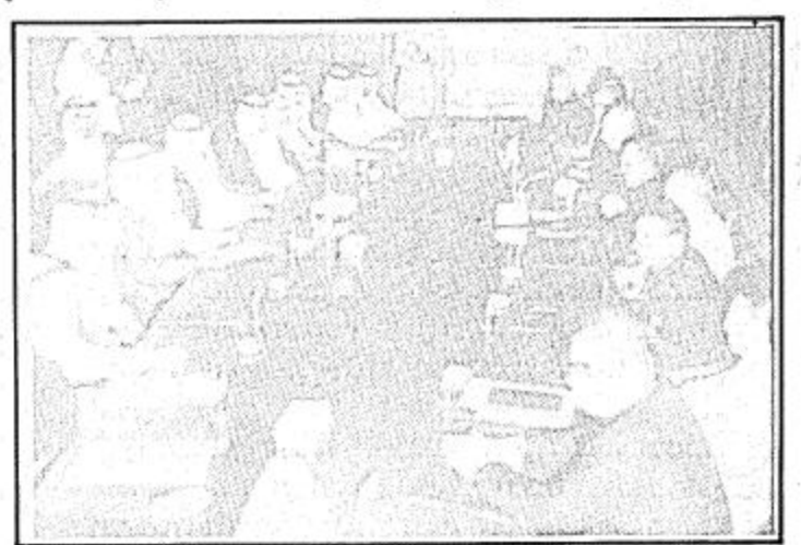
□ المحادثات الرسمية السعودية الباكستانية □

الصحف الباكسانية: عبد الله بحمل رسك والإخساء والتصنت