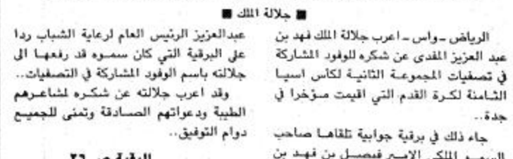
جلالة الملك - ولي العهد - سمو الرئيس العام لرعاية الشباب...