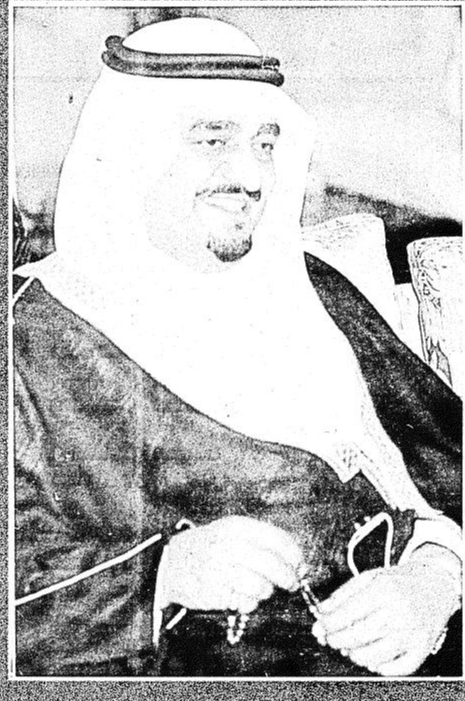
جلالة الملك فهد المعلى

٥٥ أمير الرس في «الجزيرة»: بفضل توجيهات جلالة الملك وسمو ولي عهده حققت الرس نهضة حضارية