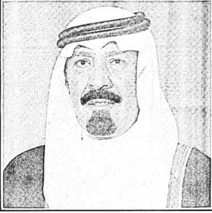
سمو ولي العهد الأمير عبدالله