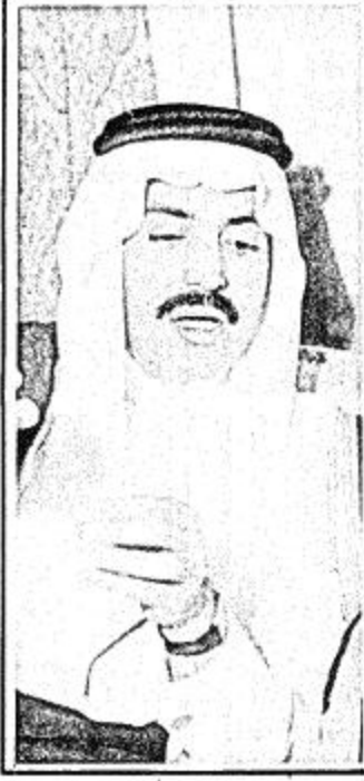
سمو الأمير عبد الإله

قال الاستاذ منصور عساف الحسين أمير الرس في اجابته على سؤال لـ (ملحق الجزيرة) عن منجزات حكومتنا الرشيدة بقيادة جلالة الملك فهد بن عبد العزيز المعلى، وسمو ولي عهده الامين في مدينة الرس والمناطق المحيطة بها من مشاريع التنمية والخدمات لتحقيق التطور والرفاهية للمواطنين بالمنطقة ان رعاية جلالة الملك مولاي الملك المعلى فهد بن عبد