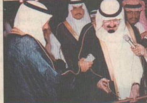
سموه يفتتح معرض (مائة عام من التطور) في جامعة الملك فهد

الظهران/ عبدالله العشري / احمد المحبوب/ يوسف الشهري رضى صاحب سمو الملكي الامير عبدالله بن عبد العزيز ولي العهد نائب رئيس مجلس الوزراء ورئيس الحرس الوطني اسس الحفل الذي اقيم على شرف سموه بقاعدة الملك عبدالعزيز الجوية بالظهران. وكان في استقبال سموه لدى وصوله مقر القاعدة صاحب سمو الملكي الامير سلطان بن عبدالعزيز النائب الثاني لرئيس مجلس الوزراء وزير الدفاع والطيران والمفتش العام وصاحب سمو الملكي الامير عبدالرحمن بن عبدالعزيز نائب وزير الدفاع والطيران والمفتش العام وصاحب سمو الملكي الامير محمد بن فهد بن عبدالعزيز امير المنطقة الشرقية وصاحب سمو الملكي الامير سعود بن نايف بن عبدالعزيز نائب امير المنطقة الشرقية وجبار القادة العسكريين واستقبل سموه عربية مشوقة تفلح خلالها انواعا من الطائرات العاملة