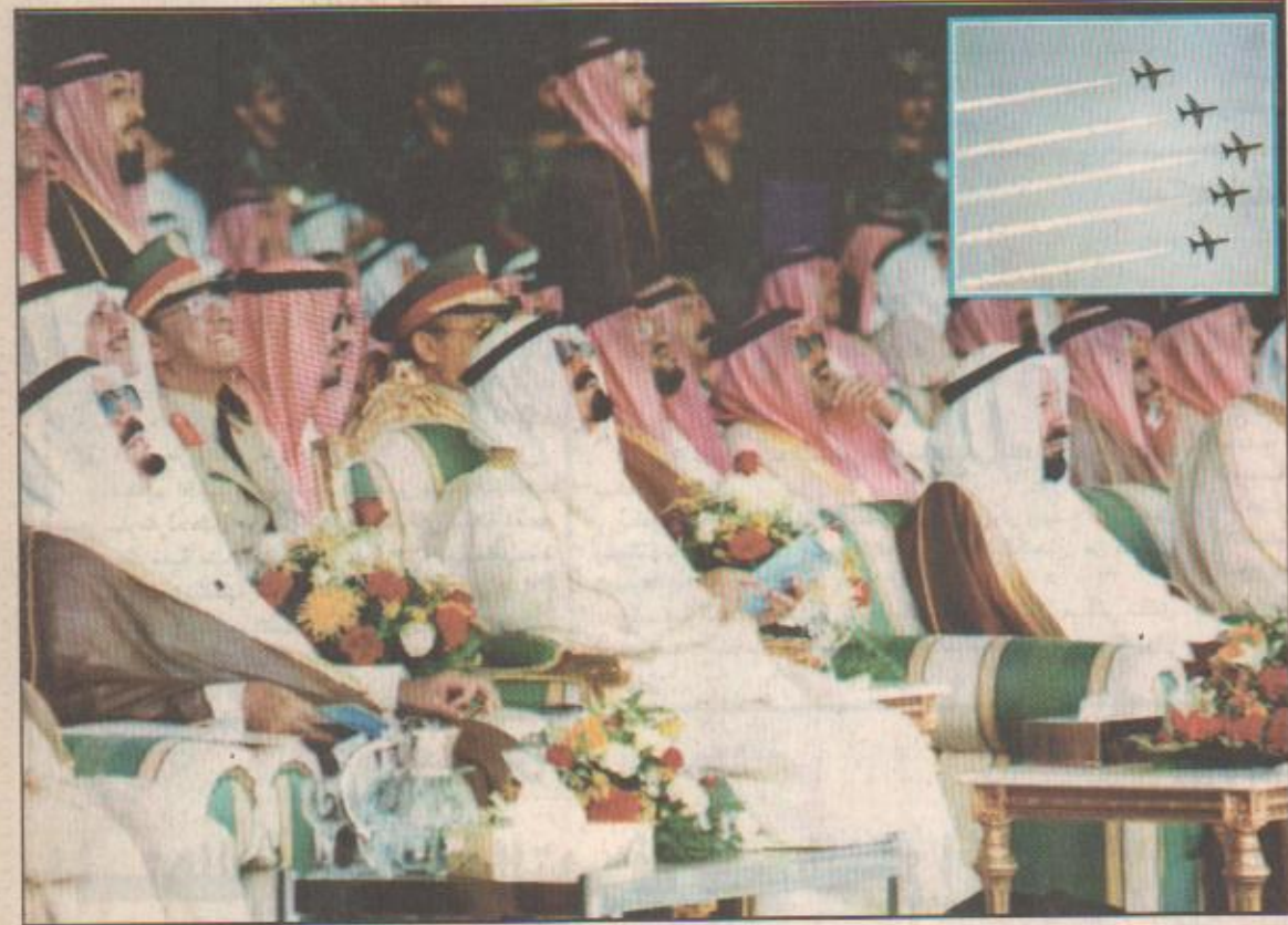
سمو ولي العهد يتابع العرض الجوي في القاعدة وفي الأتار طائرات في العرض الجوي