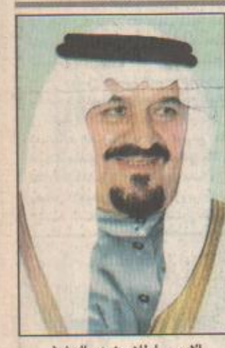
الامير سلطان بن عبدالعزيز

الوثية/ واس يعث خادم الحرمين الشريفين الملك فهد ابن عبدالعزيز ال سعود رسالة خطية الى اخيه صاحب السمو الشيخ زايد بن سلطان آل نهيان رئيس دولة الامارات العربية المتحدة الشقيقة. وقام بتسليم الرسالة صاحب سمو الملكي الامير بدر بن عبدالعزيز نائب رئيس الحرس الوطني خلال مقابلته عصر امس مع سمو الشيخ زايد بن سلطان آل نهيان، وحضر المقابلة صاحب سمو الملكي الامير فهد ابن بدر بن عبدالعزيز ومعالى رئيس المجلس الوطني الاتحادي بولاية الامارات محمد خليفة الجنبوت وسفير خادم الحرمين الشريفين في دولة الامارات السفير صالح ابن محمد الغفيل. وتتعلق الرسالة بالعلاقات الاخوية التي تربط بين قيادتي وشعبي البلدين الشقيقين.