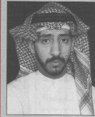
ب/قلم / صالح بن ناصر العيد

لم تكن زيارة صاحب السمو الملكي الأمير عبد الله بن عبدالعزيز في العهد نائب رئيس مجلس الوزراء ورئيس الحرس الوطني يحفظه الله للمنطقة الشرقية تشريفاً لهذه المنطقة فحسب بل كانت تشريفاً لجميع مناطق المملكة ومحافظاتها كل من مناطق بها سموه الكريم لآي من مناطق ومحافظات المملكة إلا ويصحبها افتتاح أو انشاء أو وضع حجر أساس لمشاريع التنمية التي تزدهر بها مملكتنا الغالية ولأن هذه المشاريع لا تقتصر على المنطقة التي يزورها سموه الكريم بل تمتد الاستفادة منها إلى كافة مناطق المملكة ويستفيد منها كل مواطن ومقيم على أرض هذا التراب الطاهر.