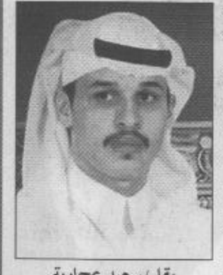
ب/قلم / سعيد عجاجية

التقدم في كافة المجالات لتحقيق الازدهار والرفاهية لبناؤنا المنطقة الشرقية ولأن المملكة تؤمن بالحاضر وتتطلع للمستقبل فقد بدأت التوجه إلى احتضان الأجيال الجديدة برفاعة أكبر كونهم رجال الفن وصناع المستقبل الذين سوف يتحملون على المدى القريب مسئوليات بناء وطن تتوافر فيه كل عناصر التطور العلمي والتكنولوجي والرقمي المدني والعمراني. ومؤسسة رعاية الموهوبين التي وضع حجر الأساس لها ولي العهد الأمين يوم الاثنين الماضي هي إحدى الدعائم التي يبني عليها مستقبل الأجيال القادمة وهو التوجه الذي تأخذ به كل الدول المتقدمة وهو دليل واضح على وجود رغبة جادة بتفعيل النظرة المستقبلية لدى ولاة الأمر في هذا الوطن للتخول في إسحاق مع الزمن كي تلحق بقطار التفوق والتقدم العلمي الذي يتسابق العالم للوصول إليه. إن رعاية الأجيال الجديدة بطرق علمية وتربوية تستهدف أول ماتستهدف رعاية الموهوبين واتاحة الفرص لهم ليحققوا التفوق في شتى المجالات والأخذ بكل أسباب المعصر.