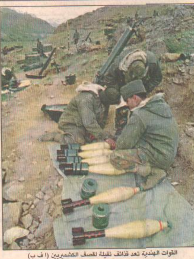
القوات الهندية تعد قذائف ثقيلة لتصف الكشميريين