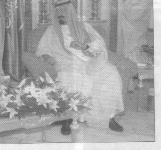
استقبال الرئيس الفلسطيني «واس»