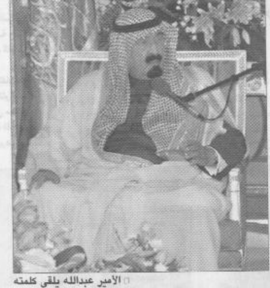
الأمير عبدالله يلقي كلمته

القبض على مرتكبها خلال شهر أوشهرين وله الحمد. والملك فرجال المباحث العامة يستحقون منكم انتم ومن كل الشعب السعودي وما الشكر والعرفان لهم). وأردف يقول: اتنا جزء من العالم نتأثر بما يتأثر به في كافة النواحي ومنها التأحية الاقتصادية التي يتحتم علينا معها شدة الاجتهاد لئلا حتى تنتهي هذه الضائقة الدولية. وقال سموه في ختام كلمته: (ان كان لدى أحد منكم رأي أو سؤال فانا مستعد للاجابة عليه). عقب ذلك على معالي مدير عام المباحث العامة الفريق أول صالح بن طه خيسان كلمة عبر فيها عن سعادت وزملائه منسوبي القطاعات الأمنية بقاء سمو ولي العهد والاستماع الى توجيهات سموه ورائته السديدة في مواجهة الأحداث والتطورات التي تشهدها المنطقة والعالم مشيراً الى ان هذه الأحداث والتطورات أكدت صلابه هذه البلاد وتماسك نسيجها الاجتماعي والأمني بفضل الله تعالى ثم بفضل تشكك أهل هذه البلاد بعقيدتهم الإسلامية في ظل قيادة الهمة الله الحكمة وبعد النظر وقوة الإرادة. وأعرب معاليه عن تشرفه منسوبي القطاعات الأمنية بالقيام بأداء واجبه