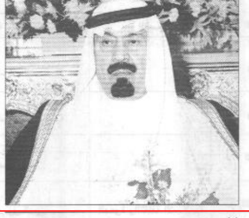
نائب خادم الحرمين الشريفين يتلقى اتصالا من الحريري

نائب خادم الحرمين الشريفين يتلقى اتصالا من الحريري جدة/ واس تلقى صاحب السمو الملكي الأمير عبدالله بن عبدالعزيز نائب خادم الحرمين الشريفين اتصالا هاتفيا أمس من دولة رئيس وزراء لبنان رفيق الحريري. وجرى خلال الاتصال بحث الأوضاع العربية والدولية الراهنة وبخاصة تطورات الأحداث في فلسطين المحتلة وما تعرض له الشعب الفلسطيني من اعتداءات مستمرة من سلطات الاحتلال الإسرائيلية. كما تم بحث آفاق التعاون بين البلدين الشقيقين وسبل دعمها وتعزيزها.