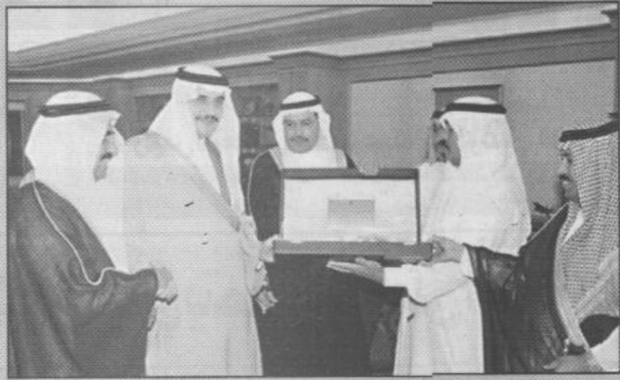
لقطات من استقبالات صاحب السمو الملكي الأمير محمد بن فهد بن عبدالعزيز أمير المنطقة الشرقية للسفير الصيني ود. خالد بكر