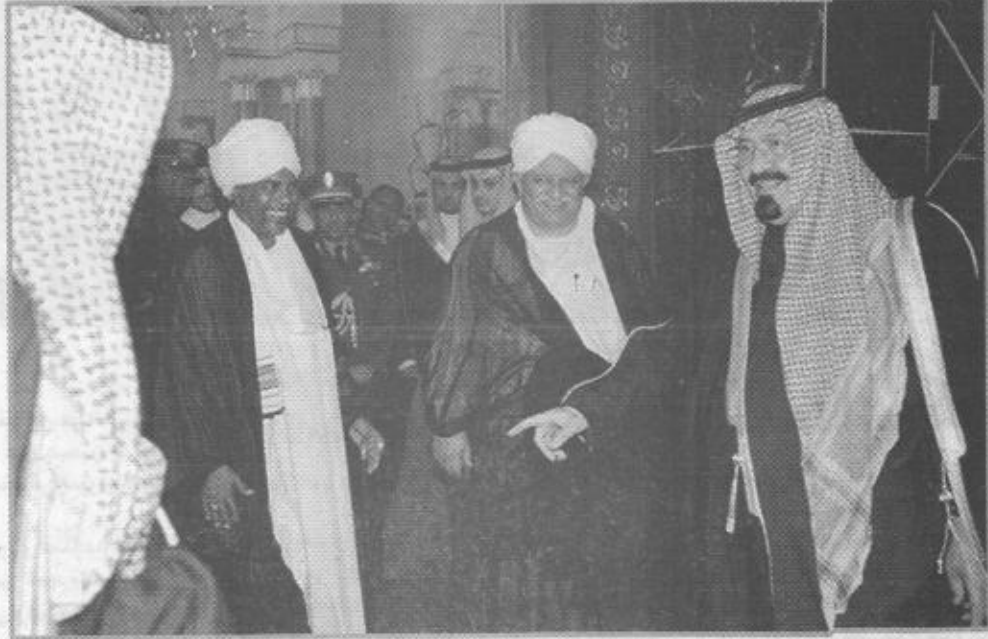
سمو ولي العهد يستقبل الرئيس السوداني

السودان عبد الله بن محمد الحارثي. بعد ذلك صعد سمو ولي العهد وضيافته الكبير منصة الشرف حيث عزف السلامان الوطنيان السوداني والسعودي. ثم استعرضا حرس الشرف بعدها صاحبه فخامة الرئيس مستقبليه صاحب السمو الملكي الأمير متعب بن عبد العزيز وزير الأشغال العامة والإسكان وصاحب السمو الملكي الأمير نايف بن عبد العزيز وزير الداخلية وصاحب السمو الملكي الأمير سعود الفيصل وزير الخارجية وصاحب السمو الملكي الأمير تركي الفيصل رئيس الاستخبارات العامة وصاحب السمو الأمير فهد العبدالله مساعد وزير الدفاع والطيران لشؤون الطيران المدني واصحاب المعالي الوزراء وكبار المسؤولين من مدنيين وعسكريين واعضاء السفارة السودانية لدى المملكة. وبعد استراحة قصيرة في صالة المطار تناول خلالها القهوة العربية غادر ضيف البلاد الكبير في موكب رسمي إلى المقر بعد لقائهم.