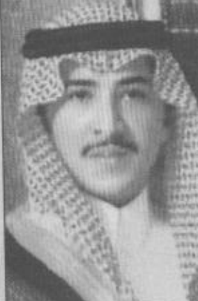
بقلص / صلاح بن عبدالهادي القحطاني

جاءت زيارة صاحب السمو الملكي الأمير عبدالله بن عبدالعزيز ولي العهد نائب رئيس مجلس الوزراء ورئيس الحرس الوطني تتويجا لمسيرته العزراء في التلاحم بين القيادة والمواطن السعودي الذي يبذل قبايته حيا بحب ويعضدها ولاء ووفاء وعملا.. وولي عهدنا المحبوب أحد قيادات هذا البلد الامين الذي اعطى بسخاء وبذل الكثير من أجل رفعة الوطن ورفاهية المواطن.. ظل صادقا مع نفسه ومواطنيه.. عاملا على تنمية الوطن والتنمية للمواطن.. رافعا هموم الامتين العربية والاسلامية في المحافل الدولية.. موضعنا ومنتسكا بالمبادئ والمواقف التي تتسجم مع تطلعات امتنا.. وظل يطالب بأعلى صوته مبرر حقوق الشعب الفلسطيني وينادي بالصلاف والاقليات الاسلامية في كافة أرجاء العالم.. ووجدت نداءات سمو ولي العهد المحبوب أصدا وأسمعة وتجابوب الجميع مع اطروحاته العادلة والمخلصة.. الكل استمع الى الصوت القوي القادم من قلب الامتين العربية والاسلامية.. ان زيارة سمو ولي العهد الى المنطقة الشرقية هي إمتداد لعطايا وجهود سموه الكريم من أجل وطنه ومواطنيه فالسعوديون جميعا في نظر سموه متساوون كأسنان المشط ومناطق المملكة كلها في رؤاه الوطني الكبير الذي يحتل المساحة الكبرى في قلب سموه وقلب كل مواطن.