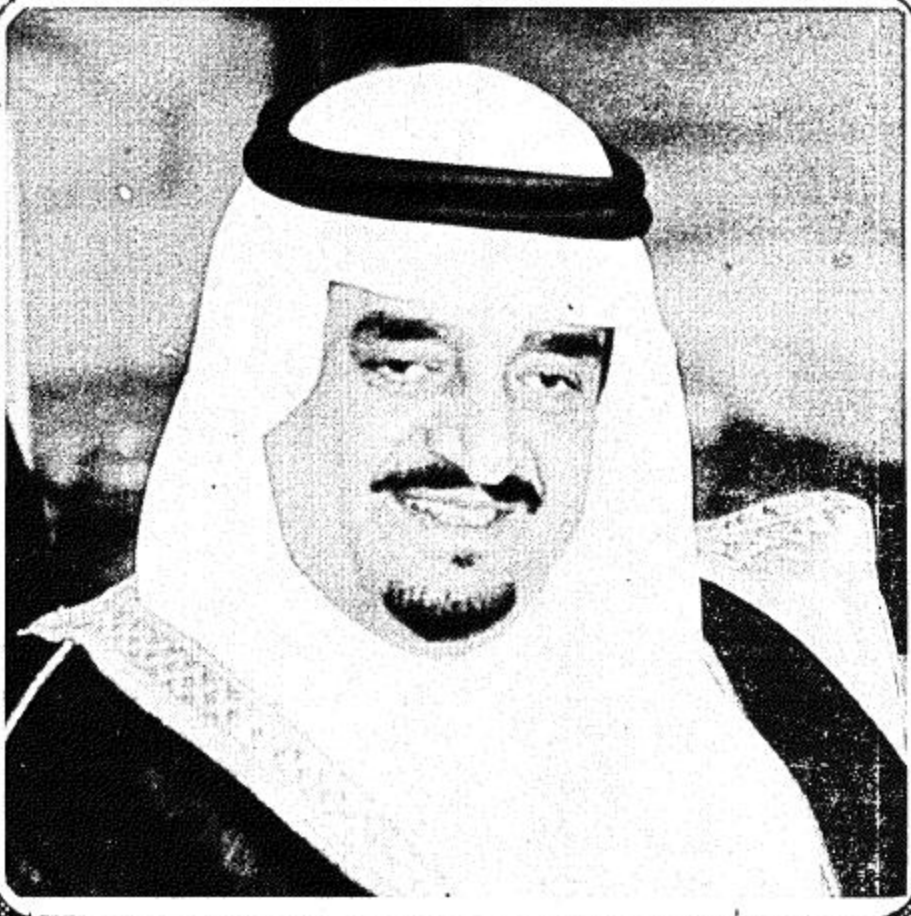
□ جلالة الملك الفهد □

وكيل إمارة المنطقة يعرب لـ "الجزيرة" .. عن ترحيب المواطنين بالزيارة الملكية الميمونة