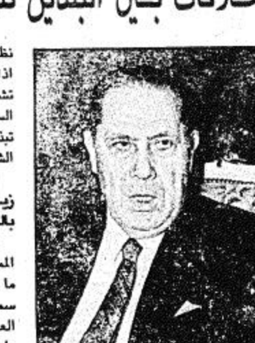
مشاور ديوجول وجلالة الملك فيصل، رحمه الله وهذه العلاقات لم تتوقف ابداً بسبب مناع الثقة التي يسودها، خاصة وان الدولتين دائماً ما تتطابق وجهات

العزيز اتفاقية تشمل تبادل المعلومات ما بين الوزارتين خاصة تلك المتعلقة بالاساليب مكافحة الارهاب والحدود بالإضافة الى التعاون الفني في المجالات الاخرى. وكشف معاليه بأنه سيتم تشكيل لجنة مشتركة تعقد اجتماعاتها بانتظام والتي ترجع في ابحاثها لتحقيق التعاون المنشود في هذا المجال وفيما يلي نص الحديث. ان من الواضح في الوقت الحالي ان العلاقات ما بين المملكة العربية السعودية وفرنسا في تزايد مستمر من يوم لآخر. كيف تفرى سعادتكم مستقبل هذه العلاقات؟ العلاقات ما بين المملكة العربية السعودية وفرنسا تتميز بنوع من الصادقية عالية المستوى والصدقة اللقاء ما بين الرئيس الفرنسي السابق