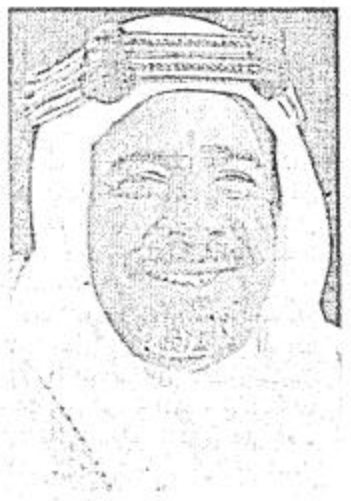
وقد اضاف سموه حول الحرب مضى عليها سبع سنوات بين الدولتين المسلمتين لم يستقد منها سوى العدو

التمريض بالامتنين العربية والاسلامية، وانما من جانبنا نؤيد جميع الجهود المبذولة في سبيل ايقاف هذه الحرب قطعاً لادبر رغبات العدو وتحقيق الصيغة الاسلامية التي تربو اليها جميع الشعوب العربية والاسلامية من منطلق الاخاء الذي حدت عليه الاسلام. كما تحدث سمو الشيخ خليفة بن سلمان آل خليفة رئيس وزراء دولة البحرين والذي أكد على ضرورة مواصلة التنسيق في المجالات الاعلامية وترسيخ الوعي حيال ما يحاك للمنطقة والوطن العربي من سانسات اعلامية وتشكيك اعلامي لا يمت للحقيقة بصلة. ونوه سموه بما بلغت اجهزة الاعلام في دول مجلس التعاون من تطور ملموس يتطلب مزيداً من المتابعة والاستنتاج بما ينشر من مغالطات والتصدي في ظل حكم دولنا الرشيد.