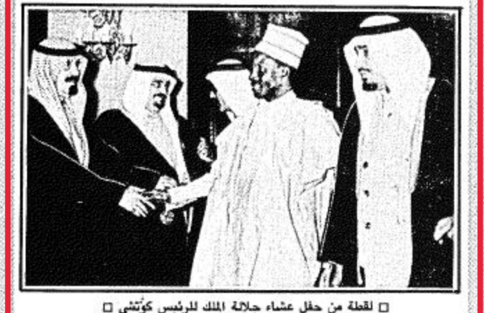
لقطة من حفل عشاء جلالة الملك للرئيس كوتشي

الرياض - واس... أقام جلالة الملك خالد بن عبدالعزيز المعدي حفل عشاء مساء أمس بقصر جلالته بالمعذر تكريماً لفخامة الرئيس حسين كوتشي رئيس جمهورية النيجر والوفد المرافق له. وحضر الحفل صاحب السمو الملكي الأمير فهد بن عبدالعزيز وفي العبد ونائب رئيس مجلس الوزراء وصاحب السمو الملكي الأمير عداة بن عبدالعزيز النائب الثاني لرئيس مجلس الوزراء ورئيس الحرس الوطني وعدد من اصحاب السمو الملكي الأمراء واصحاب المعالي الوزراء وكبار المسؤولين.