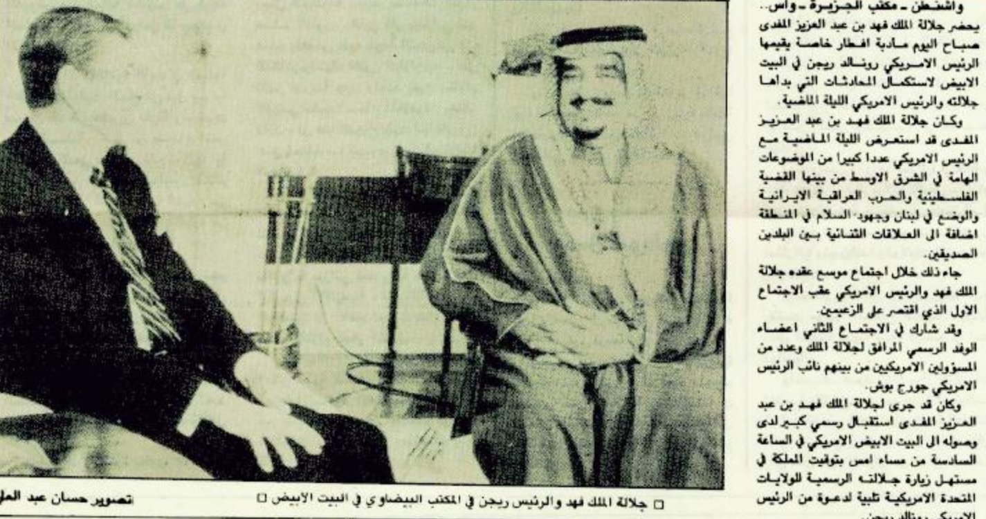
جلالة الملك فهد والرئيس ريجان في المكتب البيضاوي في البيت الأبيض