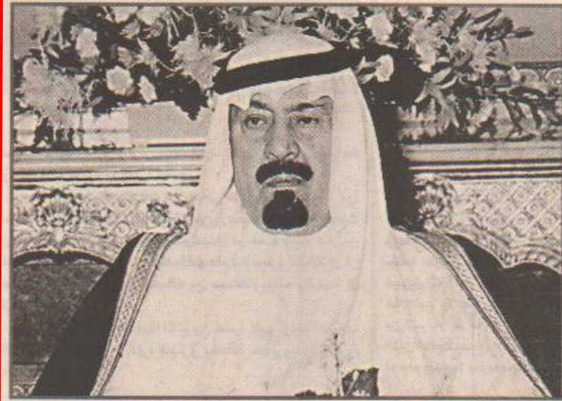
الأمير عبدالله بن عبدالعزيز

افترزت نتائج كارثة القديح تساؤلات كثيرة لدى الأهالي حول اوضاع المخيمات التجارية التي توجد في المناسبات والأفراح، وطالب الأهالي الجهات المعنية بدراسة اوضاع المخيمات وتوجيهها من نواحي السلامة بالدرجة الأولى. وذكر بعض الأهالي قصة حادثة قبل عامين راحت ضحيتها فتاة بعد تعرضها لصعقة كهربائية من سلك مكشوف في مخيم بمدينة القطيف أثناء حفل عرس. ويطالب الأهالي بتشديد الرقابة من قبل الشرطة والدفاع المدني والبلدية، فضلا عن كهرباء الشرقية للتأكد من ضوابط السلامة وفرض اشتراطات دقيقة للحيلولة دون وقوع الحوادث