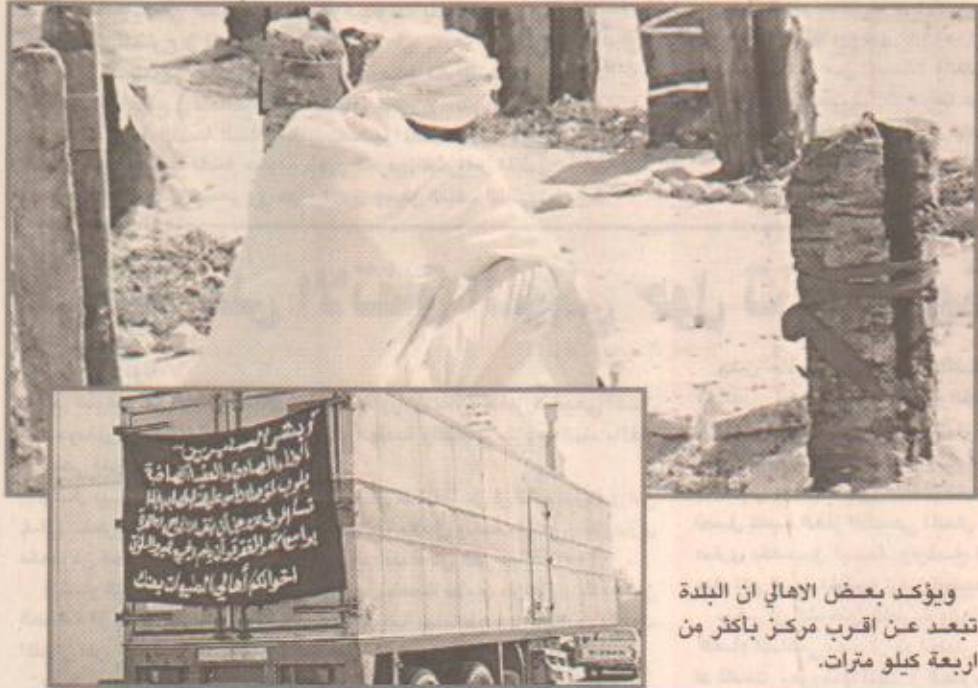
ويؤكد بعض الأهالي أن البلدة تبعد عن أقرب مركز بإكثر من أربعة كيلو مترات.

افترزت نتائج كارثة القديح تساؤلات كثيرة لدى الأهالي حول اوضاع المخيمات التجارية التي توجد في المناسبات والأفراح، وطالب الأهالي الجهات المعنية بدراسة اوضاع المخيمات وتوجيهها من نواحي السلامة بالدرجة الأولى. وذكر بعض الأهالي قصة حادثة قبل عامين راحت ضحيتها فتاة بعد تعرضها لصعقة كهربائية من سلك مكشوف في مخيم بمدينة القطيف أثناء حفل عرس. ويطالب الأهالي بتشديد الرقابة من قبل الشرطة والدفاع المدني والبلدية، فضلا عن كهرباء الشرقية للتأكد من ضوابط السلامة وفرض اشتراطات دقيقة للحيلولة دون وقوع الحوادث