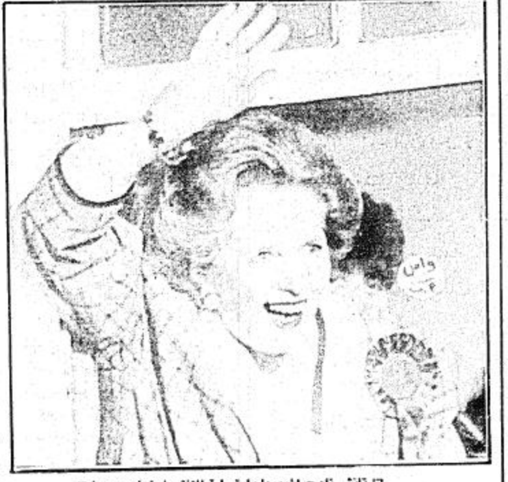
🗆 تانشر نلوح لمؤيديها وابتسامة الانتصار دعلو وجهها 🗆