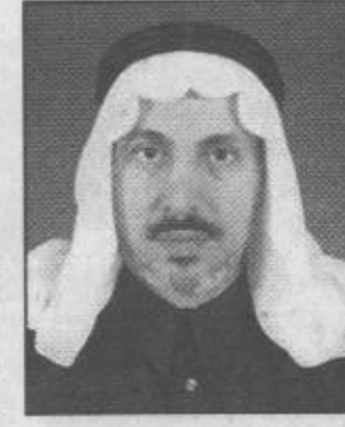
بمقدم خليفة بن عبدالعزيز التميمي

كما انشأت الوزارة عددا من مراكز التأهيل الشامل للمعاقين وعددها ١٢ مركزا ومركز لتأهيل شديدي الإعاقة وعدد ٣ مراكز اضافة الى مراكز التأهيل المهني للمعاقين وعددها ٥ والتي توفر لهم كافة المستلزمات الضرورية للمعاقين داخل هذه المراكز. كما انشأت الوزارة مراكز للتدريب والتنمية الخدمة الاجتماعية وعددها ١٥ مركزا للتنمية الاجتماعية تخدم المناطق الريفية وسبعة مراكز لخدمة الاجتماعية تخدم المناطق الحضرية اضافة الى عدد من اللجان المحلية وعدد ٥٨ لجنة تقوم بعمل مراكز التنمية الاجتماعية في المناطق التي لاتصل اليها خدمات تلك المراكز.