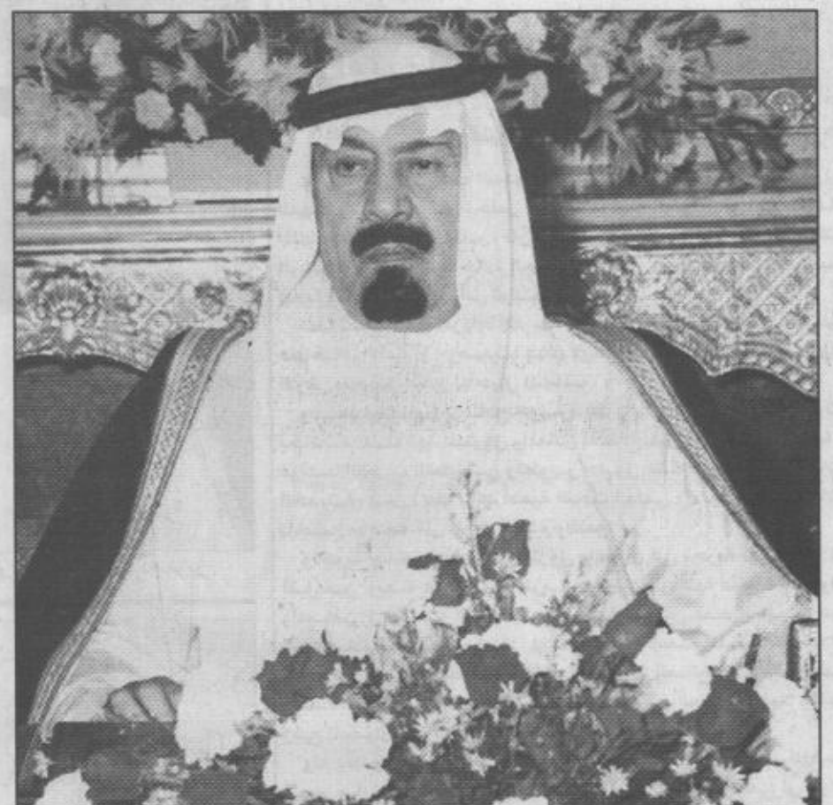
بمناسبة زيارة سيدي صاحب السمو الملكي الأمير عبدالله بن عبدالعزيز - حفظه الله - للمنطقة الشرقية

لا شك ان من الامور العظيمة التي عالجهها الاسلام معالجة دقيقة مسألة تنظيم العلاقة بين الراعي والرعية، بين الحاكم والحكوم، فأوجب الاسلام طاعة ولاة الامر في غير معصية، فقال تعالى: «يا ايها الذين آمنوا اطيعوا الله واطيعوا الرسول وأولي الامر منكم» وقال الرسول - صلى الله عليه وسلم - في الحديث الصحيح: (على المرء المسلم السمع والطاعة فيما أحب وكره، إلا ان يؤمر بمعصية، فإذا أمر بمعصية، فلا سمع ولا طاعة). وبالقابل أمر الله تعالى بالعدل والاحسان، فقال: (إن الله يأمر بالعدل والإحسان) وأخير الرسول - صلى الله عليه وسلم - ان كل راع مسؤول عن رعيته أمام الله سبحانه، وقال - صلى الله عليه وسلم - (ان الماسطين عدل الله على منابر من نور: الذين يعدلون في حكمهم وأهليهم وما ولوا). وقد أدرك الملك المؤسس عبدالعزيز - رحمه الله - هذه الحقائق الشرعية اتم الادراك، فكان - رحمه الله - يمثل العدل والاحسان الى رعيته اتم تمثيل، فكان يمد نفسه واحدا من الرعية، ومن اقواله المشهورة: (كبريكم والد، ووسطكم اخ، وصغركم ابن) انها عبارة تدل على منتهى العدل، والرفق بالرعية، والشعور بالمسؤولية الملقاة على عاتقه، ويروي التاريخ ان من أحب الاشياء الى نفسه ان ينظر بنفسه في غلظات شعبه، فكان يابها مفتوحا للجميع، لا يجد طالب حاجة مشقة، ولا عناء في