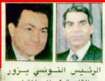
الرئيس التونسي يزور القاهرة ٩ يناير المقبل

فخامة الرئيس الشاذلي بن جديد رئيس الجمهورية الجزائرية الديمقراطية الشعبية عبر خلال مخاطبته عن سواناته الأخوية في حادث الزلزال الذي ضرب بعض المناطق في الجزائر الشقيقة مما نتج عنه سقوط بعض القتلى والجرحى. وأبدي خادم الحرمين الشريفين لفخامة الرئيس الجزائري استعداد المملكة لتقديم المساعدة الإنسانية اللازمة للجزائر. (البقية ص ٢٢)