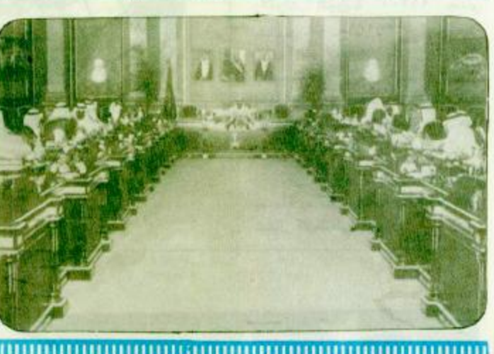
الملك فهد بن عبدالعزيز آل سعود (البقية ص ٢٢)

رأس خادم الحرمين الشريفين الملك فهد بن عبدالعزيز آل سعود الجلسة التي عقدها مجلس الوزراء بعد ظهر أمس الاثنين الأول من شهر ربيع الآخر لعام ١٤١٠هـ في قصر السلام بمدينة جدة. وعقب الجلسة قال معالي وزير الإعلام الأستاذ علي الشاسع في تصريحه لوكالة الأنباء السعودية: لقد استمع المجلس في بداية جلسة اليوم (أمس) إلى خادم الحرمين الشريفين في تحليل سياسي شامل حول