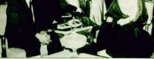
الملكة السيدة النور جوردن مونرو الذي (البقية ص ٢٢)

استقبل صاحب السمو الملكي الأمير عبدالله بن عبدالعزيز ولي العهد ونائب رئيس مجلس الوزراء ورئيس الحرس الوطني في مكتب سموه بالديوان الملكي في قصر اليمامة بعد ظهر أمس السفير البريطاني لدى المملكة السيد النور جوردن مونرو الذي (البقية ص ٢٢)