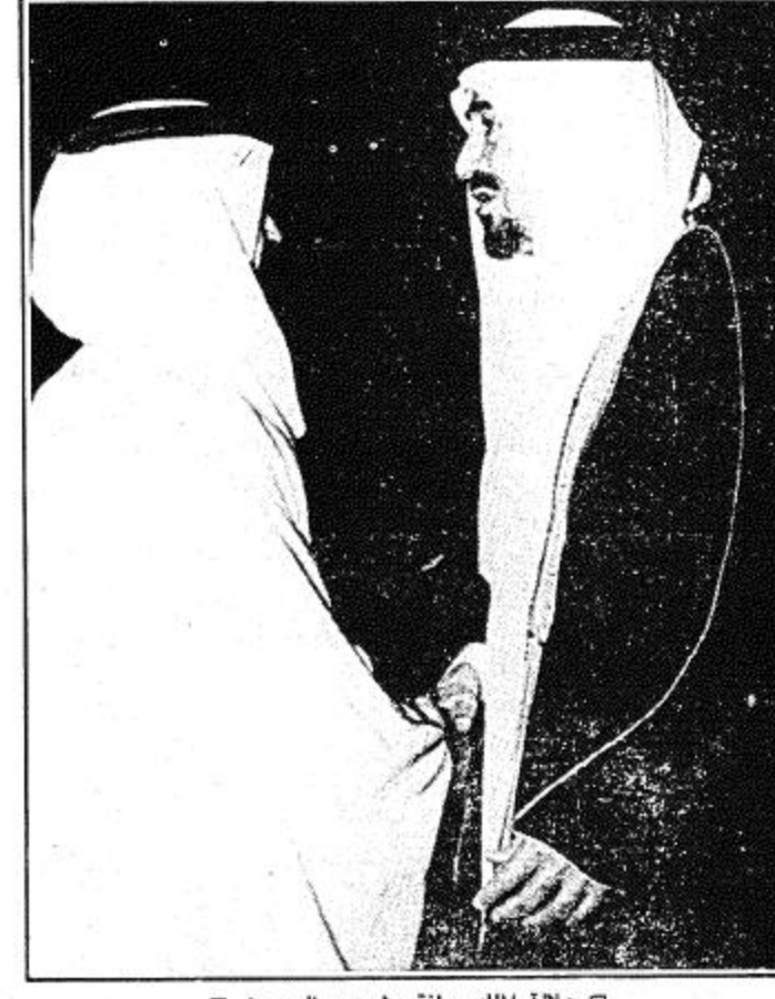
جلالة الملك يعانق ولي عهد البحرين