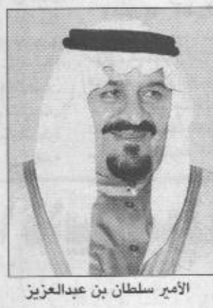
الأمير سلطان بن عبدالعزيز

الكريم في مطار أبها الإقليمي صاحب السمو الملكي الأمير خالد الفيصل بن عبدالعزيز أمير منطقة عسير ومدبرو الإدارات الحكومية ومشايخ القبائل وأعيان المنطقة وفي مساء يوم غد الخميس سيصل سمو الأمير سلطان بن عبدالعزيز حقل العشاء الذي تقيمه أمانة منطقة عسير لسموه الكريم بصالة الاستقبال الرئيسية بالخالية بابها. وفي يوم السبت ١٤١٩/١٢/١٧ هـ يقوم سمو النائب الثاني بمعاينة منسوبي القوات المسلحة بالمنطقة الجنوبية في ميدان العرض العسكري بمجموعة لواء الملك خالد الرابع واقتراح مشروع تحسين ميدان العرض كما يفتتح سموه حقل مركز عمليات المنطقة الجنوبية الجديد ثم يشرّف سموه حقل مدينة الملك فيصل العسكرية بالمنطقة الجنوبية. بعد ذلك يفتتح سمو الأمير سلطان بن عبدالعزيز مشروع توسعة العبادات الخارجية بمستشفى مدينة الملك فيصل العسكرية في يوم الأحد ١٤١٩/١٢/١٨ هـ يفتتح سمو النائب الثاني مبنى الإدارة العامة للتعليم بمنطقة عسير ثم يفتتح سموه مبنى جامع الملك عبدالعزيز في أبها كما يؤدي صلاة المغرب فيه. وفي يوم الاثنين ١٤١٩/١٢/١٩ هـ يقوم سمو الأمير سلطان بن عبدالعزيز بزيارة مجموعة الدفاع الجوي الرابعة ثم زيارة قاعدة الملك خالد.