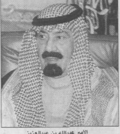
الأمير عبدالله بن عبدالعزيز

جدة - واس وجه صاحب السمو الملكي الأمير عبدالله بن عبدالعزيز وولي العهد ونائب رئيس مجلس الوزراء ورئيس الحرس الوطني برفيقة جوياسة آل معالي وزير الإعلام الدكتور فؤاد بن عبدالسلام الفارسي هذا معالي وزير الإعلام السلام عليكم ورحمة الله وبركاته وبعد.