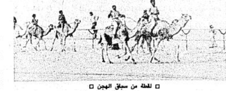
لقطة من سباق الهجن

رعى نائب خادم الحرمين الشريفين صاحب السمو الملكي الامير عبدالله بن عبدالعزيز في السابعة الخامسة من مساء امس الشوطين الثاني من سباق الهجن