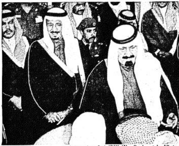
نائب خادم الحرمين الشريفين يسلم الجوائز للفائزين في سباق الهجن