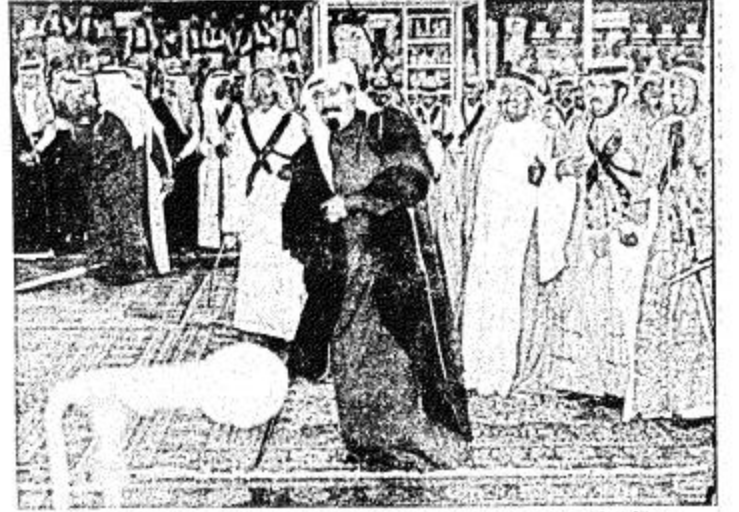
نائب خادم الحرمين الشريفين يشترك في العزفة السعودية. ويكافح حضور الحفل