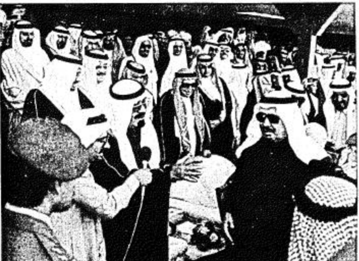
نائب خادم الحرمين الشريفين يشهد عروض الفرق الشعبية