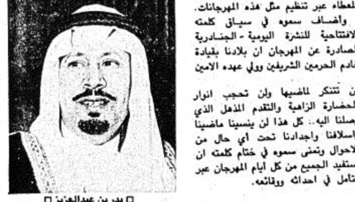
بدر بن عبدالعزيز

المعطاء عبر تنظيم حفل هذه المهرجانات. واصف سموه في سياق كلمته الانتاحية للثورة البيوتية - الحضارية