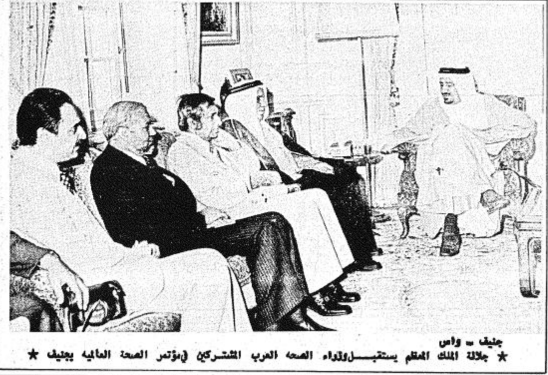
جنيف - واس * جلالة الملك المقدم يستقبل وزراء الصحة العرب المشاركين في مؤتمر الصحة العالمي بجنيف *

سمو الأمير "فهد" يصرح بعد مباحثاته مع نائب الرئيس المصري: التضامن العربي هو القوة الحقيقية لنا .. ولكن تؤشر فيه الخلافات العابرة مسئول مبارك في الرياض يشكره في استقباله الأمير فهد بن عبد العزيز