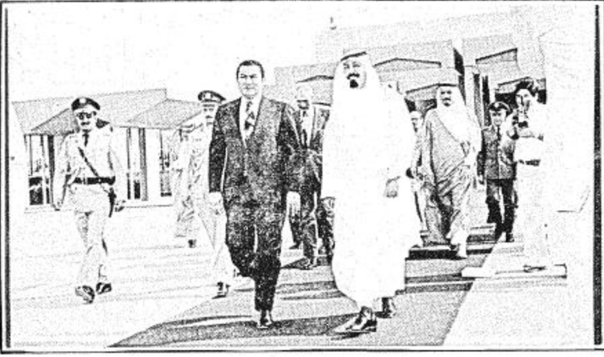
صاحب السمو الملكي الامير عبدالله بن عبدالعزيز يسود نائب الرئيس المصري عند مغادرتي الرياض يوم أمس